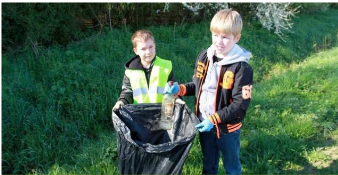
290 adultes et enfants ont participé à l'opération

290 personnes se sont donné rendez-vous au complexe sportif de Bousbecque, à l'école Brassens de Comines, à la place de Deùlémont, au rond-point « Le Jockey » d'Halluin et à la salle du Verger à Linselles. Elles ont formé des petits groupes pour arpenter les chemins communaux du territoire et ramasser les débris jetés dans la nature. Les élus et les agriculteurs locaux, directement concernés par le sujet, ont accompagné les participants. En fin