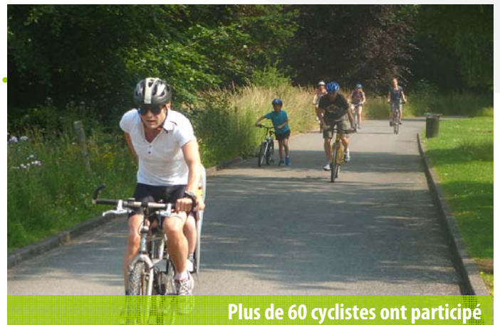
Plus de 60 cyclistes ont participé

Le samedi 6 juillet, Euralys a organisé pour ses habitants la découverte à vélo d'une partie de la boucle de randonnée. Sous un soleil radieux, plus de 60 personnes (élus, cyclistes, familles, Français et quelques Belges, etc.) ont ainsi participé au rendez-vous, du port de plaisance d'Halluin au château Dalle-Dumont de Wervicq-Sud, en passant par Bousbecque. Cette excursion a été le premier coup de pédale sur cette boucle qui doit voir concrètement le jour dans les prochains mois !