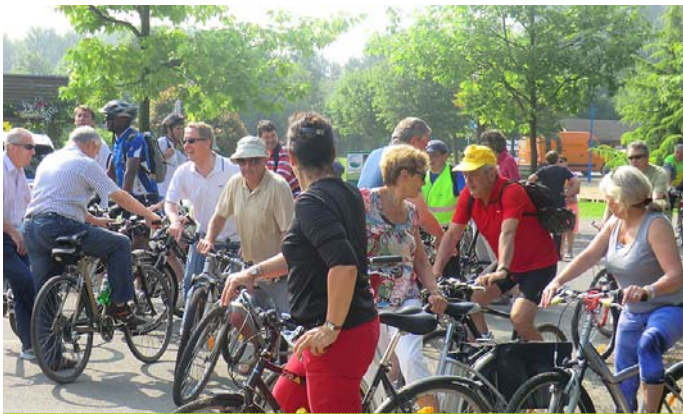
Départ du port de plaisance d'Halluin

Reposant sur les circuits existants inscrits au Plan départemental des itinéraires de promenade et de randonnée, cette boucle forme un « double 8 » d'une longueur de 70 km et traverse l'ensemble du